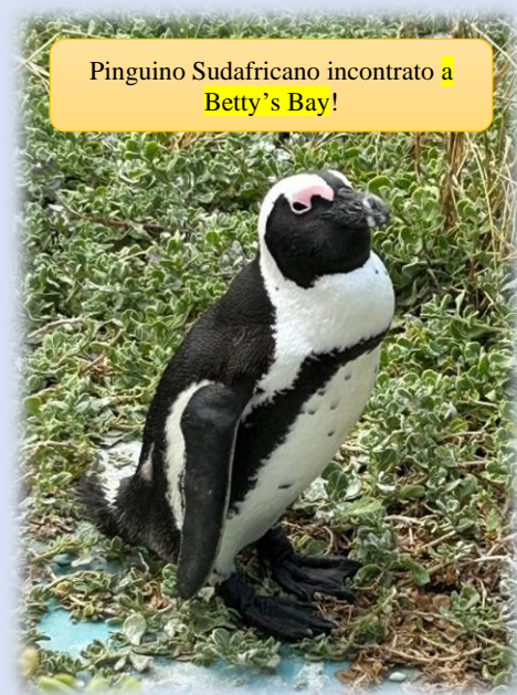
Pinguino Sudafricano incontrato a Betty's Bay!

Costruiamo ponti (García) febbraio 2025. Quando si tratta di relazioni, possiamo scegliere se costruire muri o ponti. Le nostre sfide più grandi nella vita spesso riguardano come imparare ad amare il prossimo come noi stessi (Matteo 22:39). Ci vuole uno sforzo per raggiungere gli altri. Gesù ha insegnato che è abbastanza facile prendersi cura di chi ci vuole bene, ma la vera prova inizia quando incontriamo qualcuno che troviamo più difficile da amare (Luca 6:32-34). Molto probabilmente c'è un motivo per cui il nostro vicino è un brontolone o la cassiera è acida. Eppure, un sorriso, qualche parola d'incoraggiamento o un atto di gentilezza possono bastare ad aiutarli ad abbandonare la scontentezza e a uscire da un periodo buio.