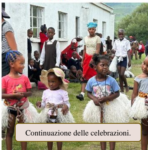
Continuazione delle celebrazioni.