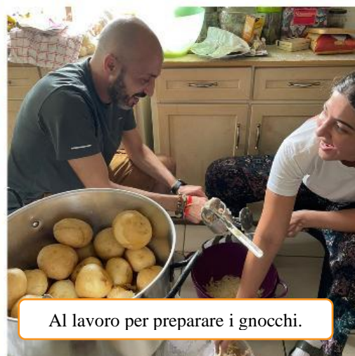
Al lavoro per preparare i gnocchi.