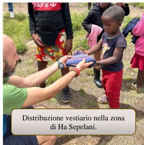
Distribuzione vestiario nella zona di Ha Sepelani.