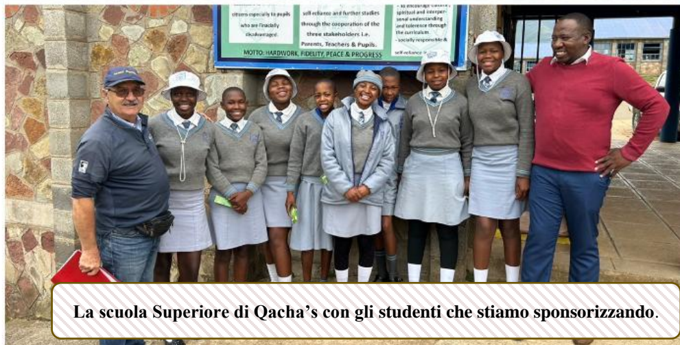
La scuola Superiore di Qacha's con gli studenti che stiamo sponsorizzando.