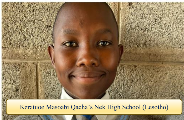
Keratuo Maseabi Qacha's Nek High School (Lesotho)