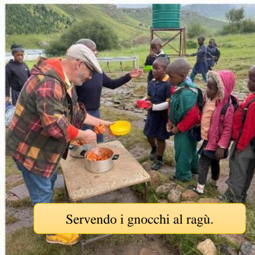
Servendo i gnocchi al ragù.