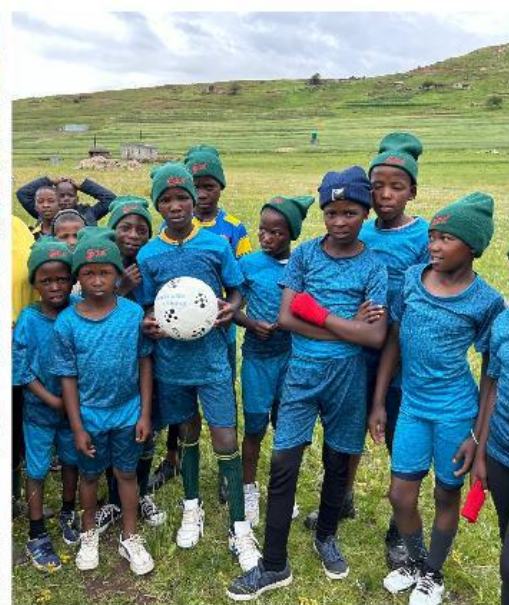
Torneo di Calcio 5 Assi, distribuzione di premi ai concorrenti.