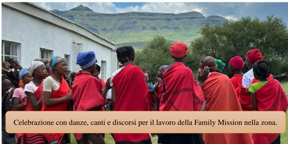
Celebrazione con danze, canti e discorsi per il lavoro della Family Mission nella zona.