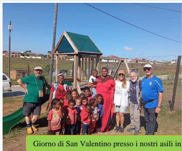
Giorno di San Valentino presso i nostri asili in (Port Elizabeth) Gqeberha