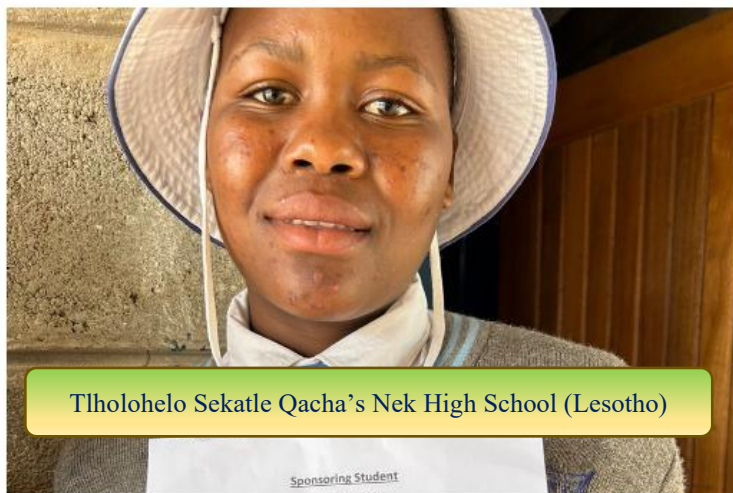
Tlholohelo Sekatle Qacha's Nek High School (Lesotho)